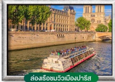
ล่องเรือชมวิวเมืองปารีส