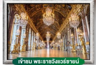
เข้าชม พระราชวังแวร์ซายน์

พิกัดกลางเมือง ใกล้เคียง Metro เดินทางสะดวก